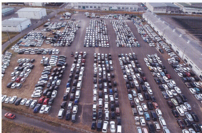
▲仙台市に設けられた被災車両集積のヤード