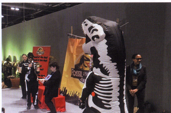
▲小泉環境相が受賞した化石賞には若者の意見が反映している