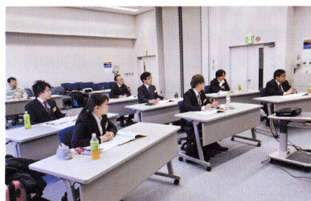
▲静岡県裾野市で開かれたフロント業務セミナー